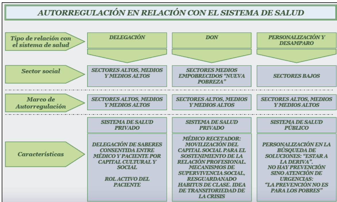
Gráfico 4. Autorregulación de relación con el sistema de salud.