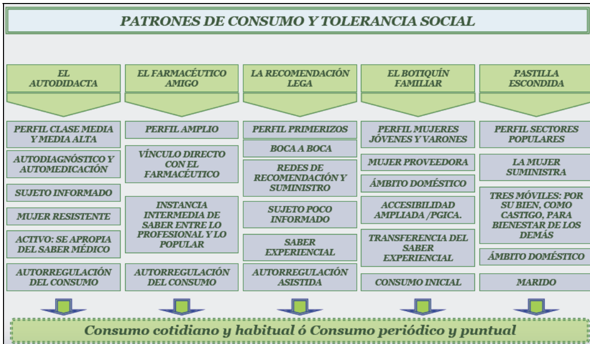
Gráfico 3. Tipología de consumo.